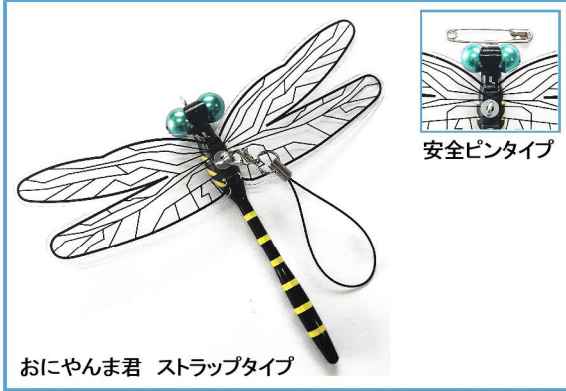
おにやんま君 ストラップタイプ