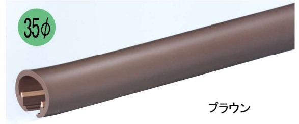
BR-735SH スマートラインS 笠木 (PVC)

常温施工タイプの笠木の取り付け方 動画はPシリーズ「BR-735HK スマートライン H笠木」の事例ですが、是非ご覧ください。 H笠木とS笠木はカバーコードを入れる順番 が逆になりますが、取り付け方法は同じです。