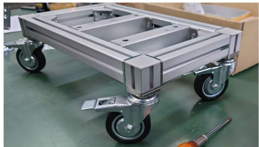
別売のキャスターを取り付ければ、溶接なしで台車も簡単に作れます。