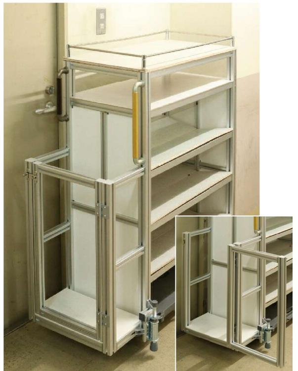
移動時に積載物が落ちないように両端からセンターに向けて棚に傾斜を付けたり、長尺ものを立てるスペースも設けた機能的なワゴン。弊社で製品の出荷に使っています。