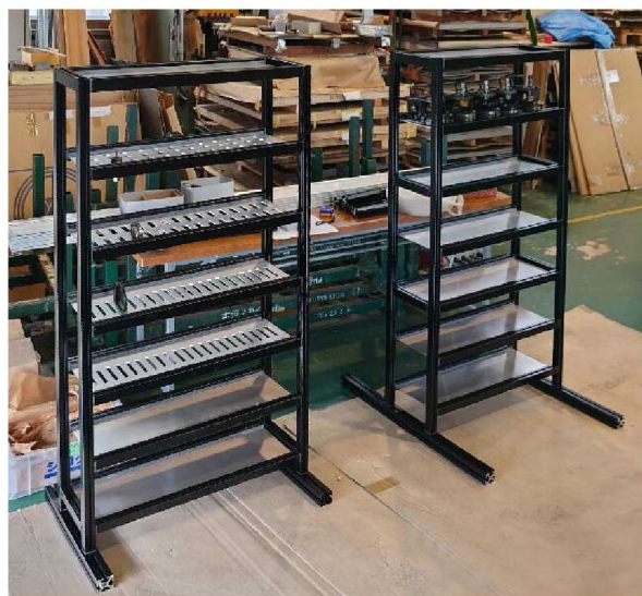
工作機械の専用ツールを保管するためのラック。ツールがぴったり納まる形状にステンレス板をレーザーカットした棚板を載せることで、取り出しやすく美観も向上