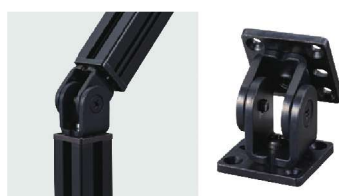
じざい UJ-1302 自在ジョイントP型