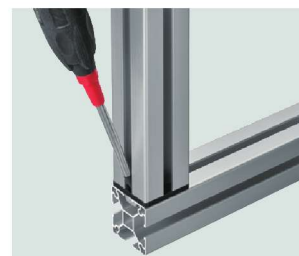
斜めから楽に締め付け可能