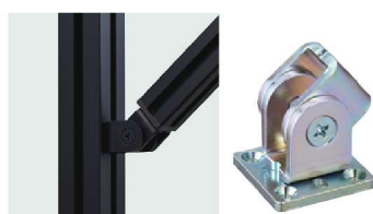
じざい UJ-1301 自在ジョイントPS型

価格など使用部品の詳細は「No.20Uポールカタログ」のP.28~30をご覧ください。