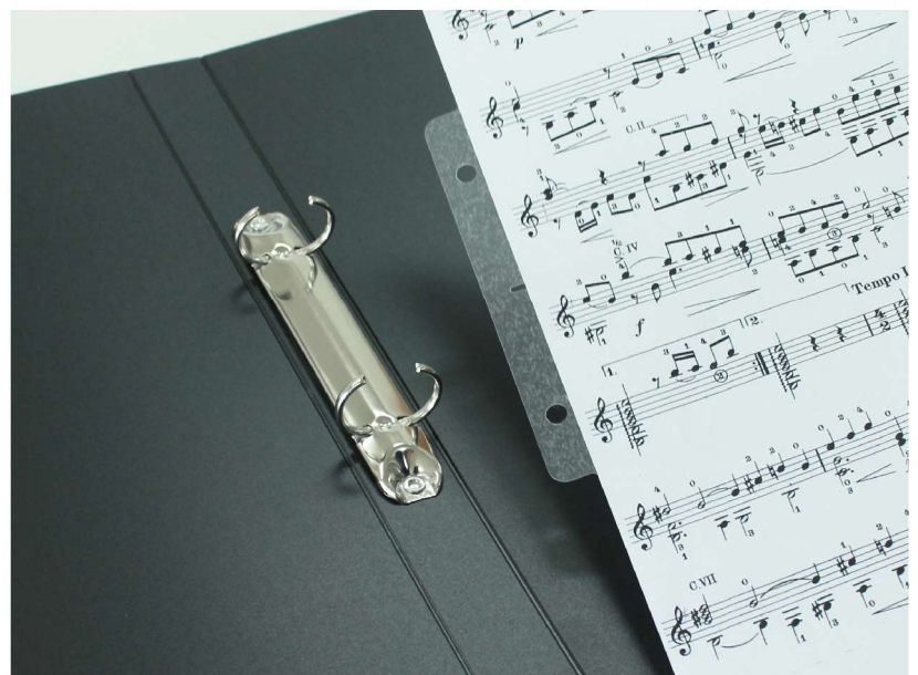
オリジナルの「ワイドリングファイル」にセット