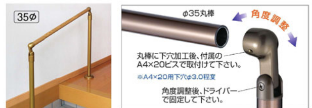
支柱 止 の取付け方