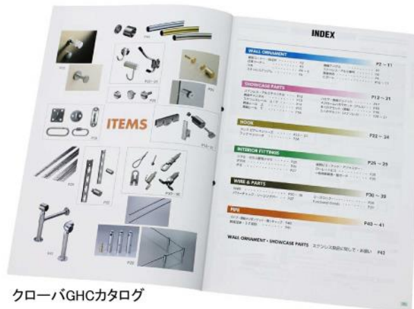
クローバGHCカタログ

※「クローバGHCカタログ」掲載商品の価格については、単価参考表をご覧ください。