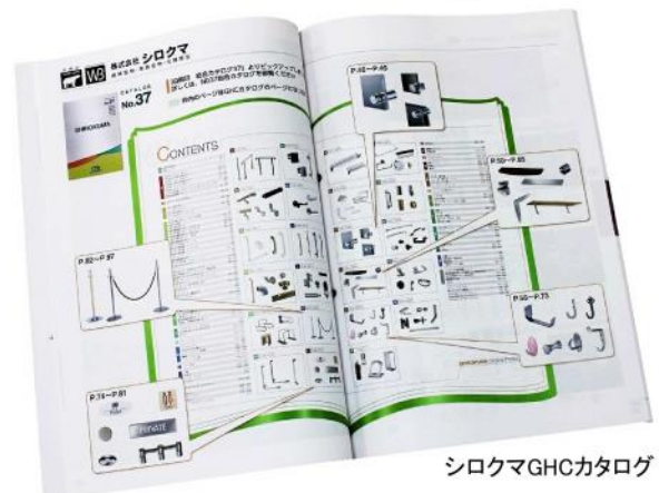
シロクマGHCカタログ