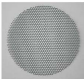
パンチングメタル