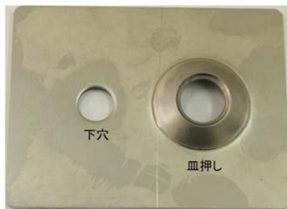
下穴+皿押し加工(M10) ※上は表面、下は裏面