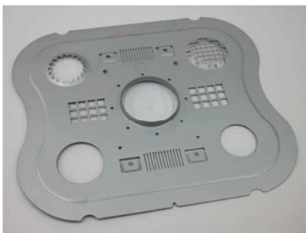
レーザー、パンチング、曲げの複合加工が可能